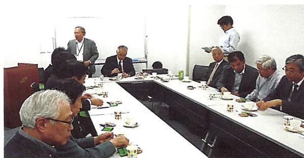
総会後の交流会風景

総会後は、神管ネット 香川会長も交え、出席正会員、出席賛助員と共に14:30~16:00まで、情報交換の場として、交流会を持ちました。