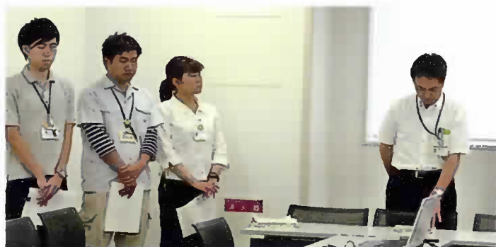
第一部講師 藤沢市建築指導課

配布され、1981年（昭和56年）5月31日以前に建築された共同住宅で非木造2階建て以上の建物を対象としたマンション耐震診断支援補助金制度について、国土交通省の「マンション耐震化マニュアル」の内容説明の他、相談窓口の紹介、藤沢市の「分譲マンション耐震診断補助金交付制度事業案内」などにより、詳しく解説されました。